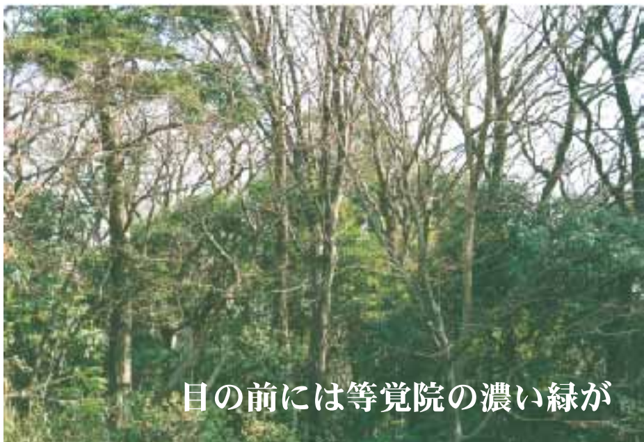
目の前には等覚院の濃い緑が

つつじの寺で市民から親しまれている宮前区神木本町にある等覚院の裏山、南傾で眺望の良い場所で緑もいっぱい。町の中のせせこましい所ではなく、駅から少し遠くても、せいせいとした見晴らしの良い所に住みたい。建物も新建材ではなく日本の木材・自然素材を使った本格木造住宅が良い土地もあまり広くはない。敷地面積は72・54㎡、6mの公道に面した土地です。土地と建物で予算は、約3500万円ぐらいならという方におすすめです。