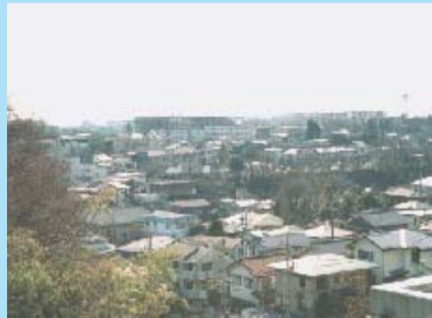
南面からの明るい眺望