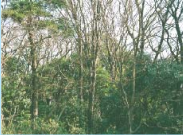
目の前には等覚院の濃い緑が

発行所 神奈川県東部建設協同組合 〒216-0011川崎市宮前区犬蔵1-4-14 TEL044-976-1151 FAX044-976-0557 フリーダイヤル0120-633-306 定価10円 発行人 白田武美 編集人 伊藤 実