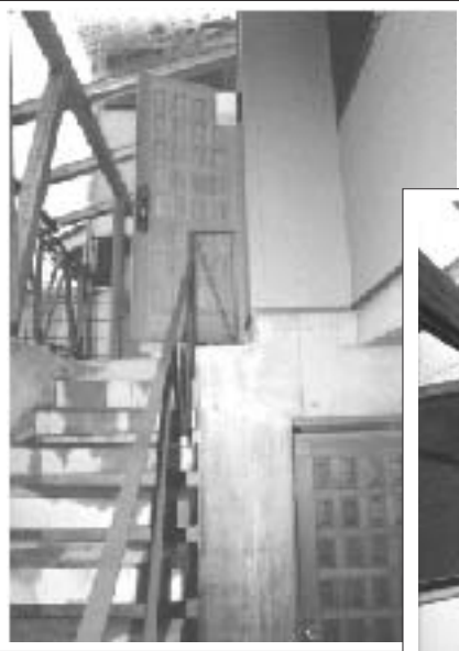
↑ 玄関と地下稽古場の入口

建物へ雨水の侵入を最小限に抑える工夫を専門用語で「雨仕舞い(あまじまい)を良くする」といいます。