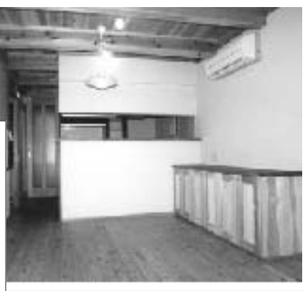
リビングルーム→ 玄関↓

木造部には国産の杉や桧・から松をふんだんに使い、木のぬくもりを感じる心安らぐ住まいになりました。